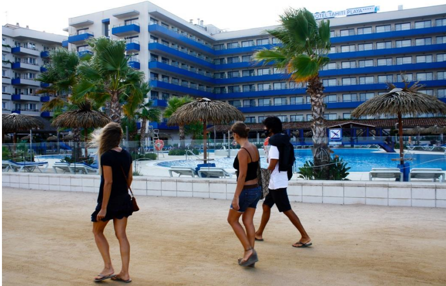
Hotel Tahití Playa de Santa Susanna aquest passat mes d'agost.

Durant l'any 2020, el principal mercat emissor de turistes a la comarca del Maresme va ser l' espanyol , amb un 83,1% del turisme total, segons l' Informe d'ocupació d'allotjaments turístics de la província de Barcelona Tourism Data System , realitzat pel LABturisme de la Diputació de Barcelona amb la col·laboració del Consorci de Promoció Turística Costa de Barcelona – Maresme i l'Observatori del Departament d'Innovació Turística d'Eurecat.