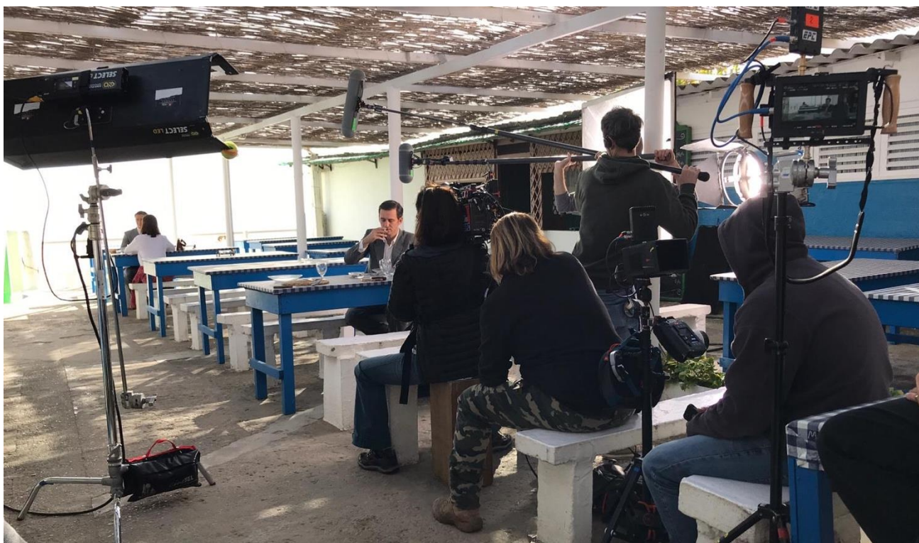
Rodatge d'una producció audiovisual al Maresme

L'any 2020 ha estat un any amb grans contraposicions a nivell audiovisual. Malgrat que el consum de sèries i pel·lícules s'ha disparat a causa del confinament , el sector ha patit de ple les conseqüències derivades de la crisi de la COVID-19. S'han hagut de suspendre rodatsges, aturar projectes i produccions, tancar sales de cinema, etc. L'engrenatge de la indústria de l'entreteniment ha estat posada en escac. Malgrat això, el Maresme ha acollit 127 rodatsges de 86 produccions diferents durant l'any 2020 .