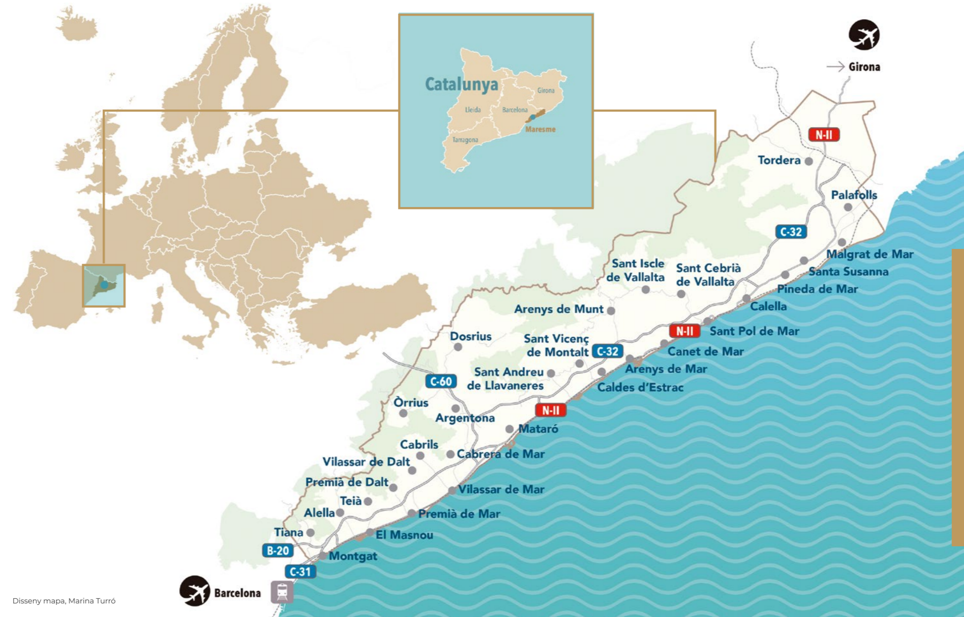
Disseny mapa, Marina Turró

Reunions i experiències amb vistes al mar