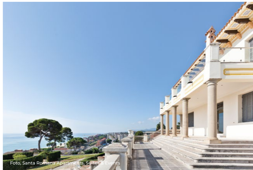
Foto, Santa Romana Apartments, Suites & Events