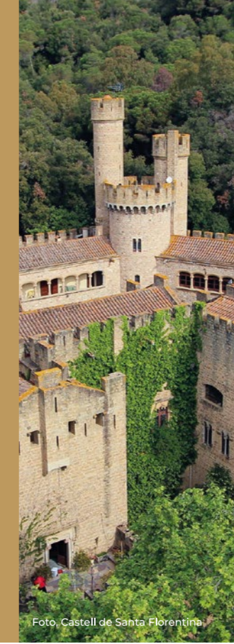
Foto, Castell de Santa Florentina

Mansions, modernist buildings, castles, theatres, country houses, wineries...